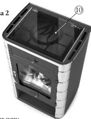
Рисунок 2. Расположение основных элементов печи